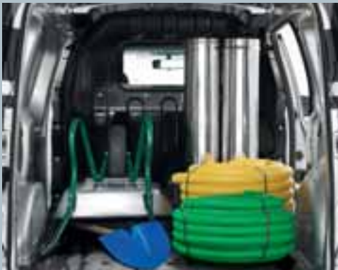
Puna ostakljena pregrada.

Nosivost vam je najvažnija? Dacia to razumije i zato je Dokker Van prostran. Dopušteno opterećenje od 750 kg*, iskoristivi obujam od 3,3 m 3 , utovarna visina od 1,27 m... Dokker Van potpuno ispunjava sva očekivanja profesionalnog korisnika. U tovarnom prostoru na raspolaganju je osam prstena za učvršćivanje** kojima se mogu posve učvrstiti i najlomljiviji predmeti. Kako bi tovarni prostor dugo ostao besprijekoran, Dokker Van je raspoloživ i s izdržljivim i nužnim bočnim oblogama te podnom oblogom prtljažnika. Dacia Dokker Van može se prilagoditi vašim potrebama. Na raspolaganju su vam tri pregrade: cjevasta, puna ostakljena i rotirajuća mrežasta (sa sjedalom Dacia Easy Seat). Bočna vrata i vrata tovarnog prostora mogu biti ostakljena ili neostakljena. Sve to omogućit će vam lakše obavljanje svakidašnjeg posla!