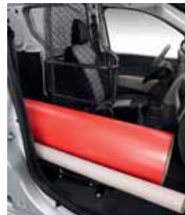
Izvađen Easy Seat.