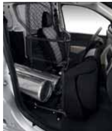
Posve preklopljen Easy Seat.