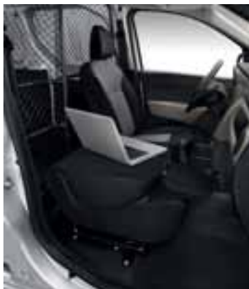
Easy Seat u položaju stolića.

Kako bi mogao prevesti još više tereta, Dokker Van nudi novo, domišljato, višenamjensko suvozačevo sjedalo Dacia Easy Seat koje se u cijelosti može izvaditi. Kad je izvađeno, utovarna duljina se povećava s 1,9 m na 3,11 m, a iskoristiv obujam s 3,3 m 3 na 3,9 m 3 . Kad mu je naslon preklopljen, možete ga praktično rabiti kao putni pisaci stolić. Od njega nedvojbeno možete zahtijevati sve!