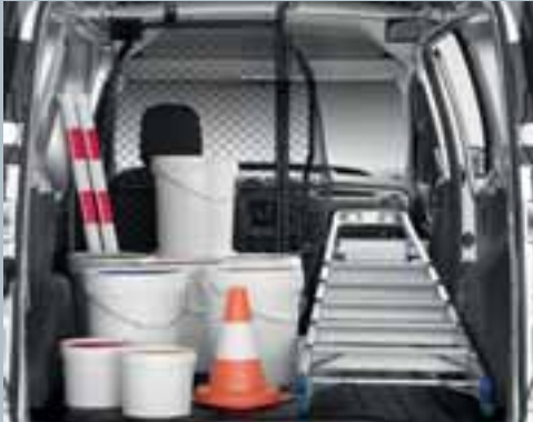
Rotirajuća mrežasta pregrada.