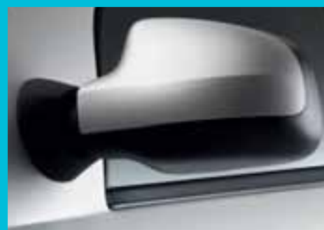
Novi dizajn vanjskih retrovizora osigurava još bolju vidljivost straga, što doprinosi sveukupnoj udobnosti i sigurnosti.