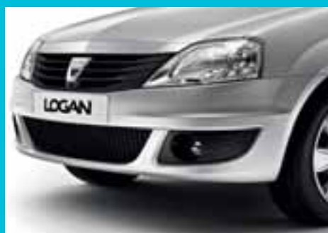
Nova maska, novi odbojnik i novi farovi: prednji dio Dacije Logan odlikuje se robusnošću i modernim izgledom.

Velikodušna po prirodi, nudi iznimnu prostornost s pet pravih udobnih sjedišta i prostranim prtljažnikom. Stražnja sjedišta, na koja se mogu udobno smjestiti tri odrasle osobe, zahvaljujući većim dimenzijama kabine dobivaju i na širini i na visini, a istovremeno omogućavaju veliku slobodu pokreta, što je pretpostavka udobnosti. Kako biste mogli ponijeti prtljagu za cijelu porodicu, prtljažnik Dacije Logan nudi najbolju zapremninu u svojoj kategoriji - 510 l! Robusni izgled Dacije Logan upućuje na izdržljivost i otpornost i u najtežim uslovima na cesti i najlošijim vremenskim prilikama. Zahvaljujući svojoj iznimnoj pouzdanosti i sigurnosti, Dacia nudi i trogodišnju garanciju. No, to nije sve, Dacia vam je pripremila i druga iznenađenja.