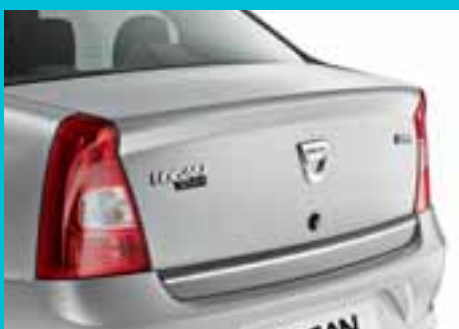
U redizajnirani stražnji dio Dacije Logan savršeno se uklapaju novi farovi i odbojnici.