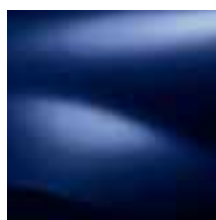
PLAVA MARINE 61H (OV)