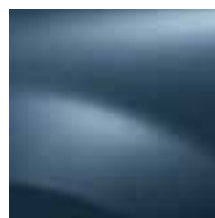
PLAVA MINÉRAL RNF (TE)